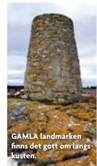
GAMLA landmärken finns det gott om längs kusten.

– Så här ser dom ut grabbar – det är bara att kasta ut och ta dom!