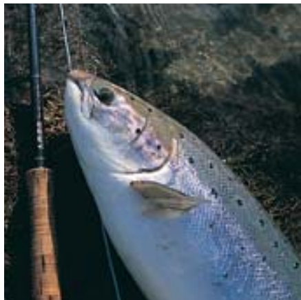
4,5 kilos »springer« från river Dee.

För att planlägga ett fiske till Skottland så bra som möjligt är det viktigt att studera älvarnas karaktär lite närmare. Generellt kan man säga att det bara är ost- och nordkustens älvar som har riktigt tidig vårlax. Speciellt kanske Dee som mynnar vid Aberdeen. I övrigt kan man välja på Tweed, Tay eller Spey som alla är ganska stora och breda älvar. Här finns även mindre älvar som South Esk och North Esk och Don.