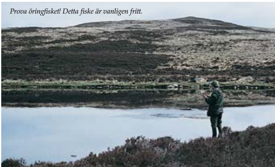
Prova öringfisket! Detta fiske är vanligen fritt.

Andra användbara adresser: www.fishdee.co.uk • www.rbrww.com www.fishspey.co.uk • www.fishtay.co.uk www.fishtweed.co.uk • www.dsfa.org www.sport.ckdfh.co.uk www.bidwells.co.uk