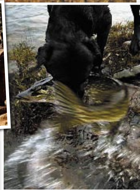
STRID. Det krävs styrka för att hålla en vild gädda. Kroken kan ibland ställa till problem.